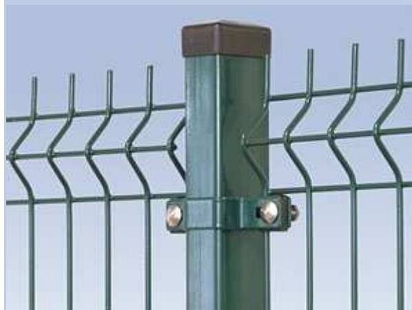
Rys. Nr 1