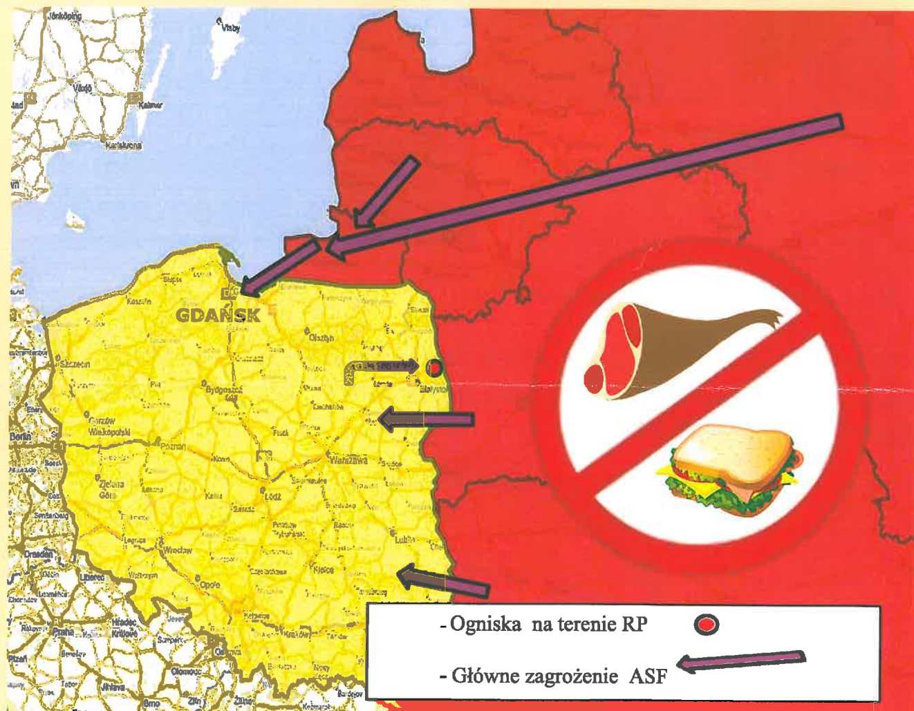
Schemat nr 1.

AFRYKAŃSKI POMÓR ŚWIŃ (ASF) w szybkim tempie dotarł do naszych granic, występuje w państwach graniczących od wschodu z Polską, a także na terenie naszego kraju. Stwierdzono występowanie tej choroby, nie tylko u dzików, ale także u trzody chlewnej. Dodatkowo służby sanitarne Federacji Rosyjskiej podały informacje o stwierdzeniu wirusa w środkach spożywczych pochodzących od świń, wyprodukowanych przez jednego z największych producentów mięsnych działających na terenie Rosji.