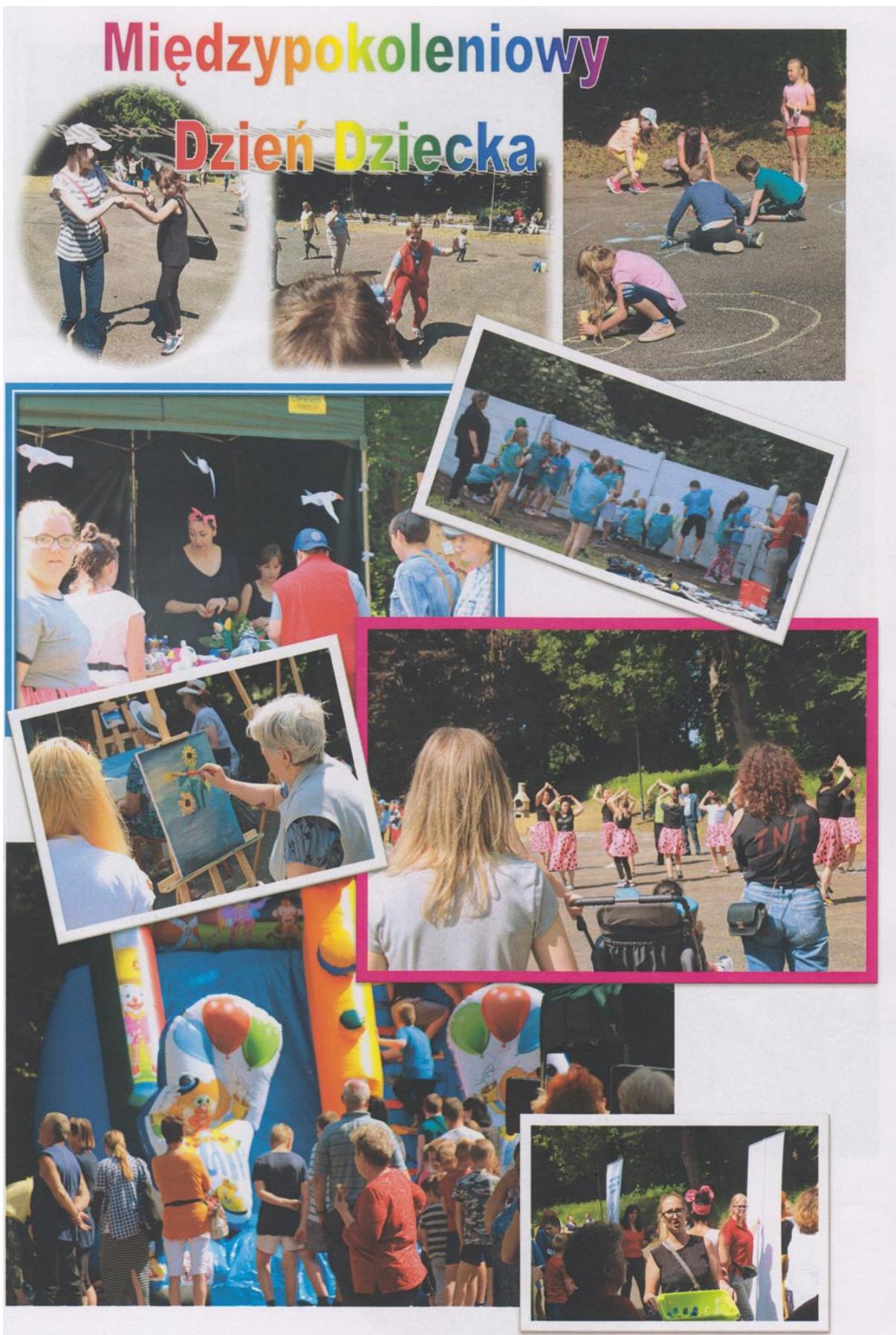
4. „Bajkowa profilaktyka”