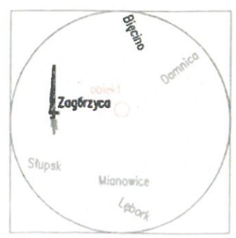
szkic lokalizacji skala 1: 100 000

projektowana kablowna rozdzielnica szafowa KRSN-PP/2R-NH2+R-NH2/2 do dz. nr 140/3 war. przyłączenia nr. P/24/029390 Z5609501