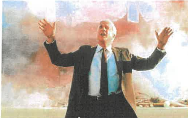
Frank Drebin (zagrał go Leslie Nielsen, gwiazda komedii wszech czasów „Czy lecisz z nami pilot?”) to najważniejsza postać serii „Naga broń”. Twórcy filmu kręcili ją z myślą o obsadzeniu go w roli głównej

Mylił się ten, kto bystwierdził, że przepełnione absurdem gagi są wyłącznie wymysłem samych twórców - choć nie można odmówić im kreatywności, to bazowali oni również na prawdziwych raportach z pracy amerykańskich stróżów prawa. Ta-