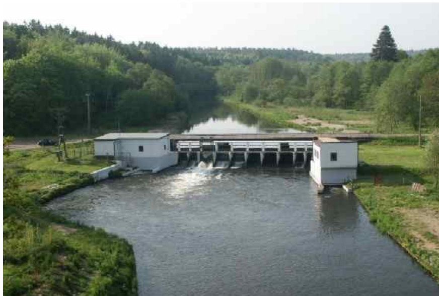
Fot. Elektrownia wodna na rzece Łupawa w m. Łebień.

Elektrownia wodna Łebień I na Łupawie - zaczęto ją budować w 1933 r., zaś Łebień II wiele lat później, bo w 1990 roku. W skład obiektu wchodzi jaz o 13 przesłach, jaz upustowy, zapory. Powierzchnia zlewni wynosi 580 km 2 , średni przepływ 5,74 m 3 /s. W obu elektrowniach zainstalowana moc wynosi łącznie 100 kW (2 turbozespoły).