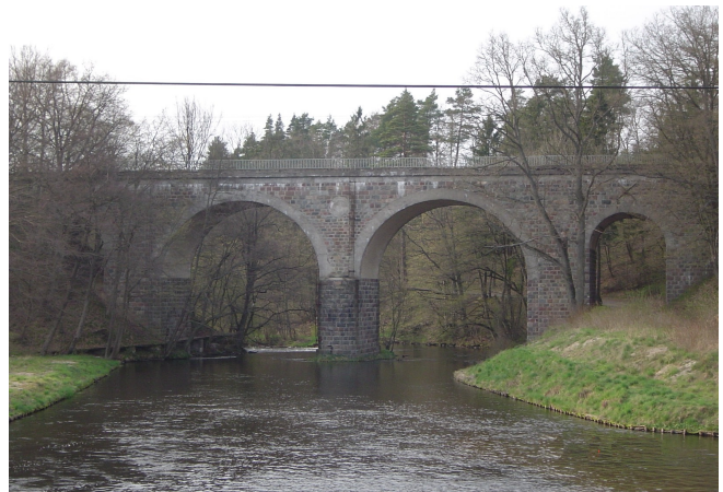
Fot. Most kolejowy w Łebieniu na rzece Łupawa