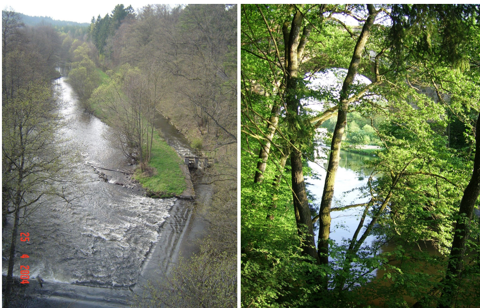
Fot. Piękno przyrody sołectwa Łebień.

Cmentarz ewangelicki założony w XIX w., zachowany starodrzew i mur ogrodzeniowy z otoczków, ewidencjonowany.