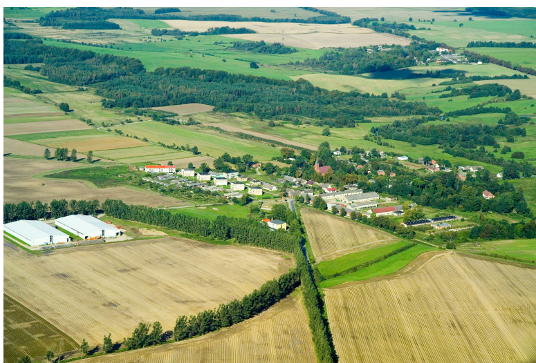
Zdjęcie lotnicze dla sołectwa Damno.

Miejscowość Damno zajmuje powierzchnię 1.147,35 ha, w tym użytki rolne 890,63 ha (77,6%), lasy 174,49 ha (15,21%), tereny zurbanizowane 50 ha (4,36%), nieużytki – 13,30 ha (1,16%), wody 17,03 ha (1,48%) oraz tereny różne – 1,90 ha (0,17%).