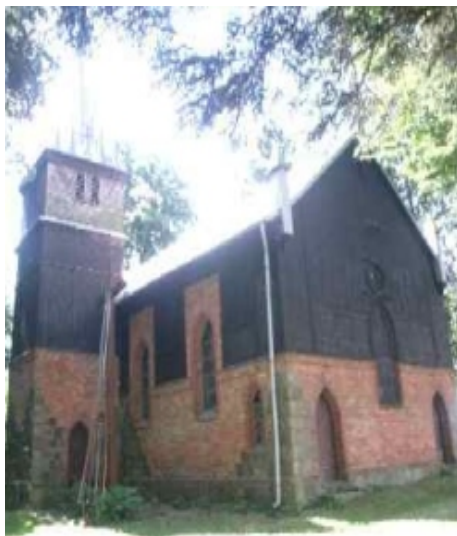
Fot. Kościół w Domaradzu

Kościół ewangelicki ob. rzym.- kat. fil. p.w. św. Stanisława Kostki w Domaradzu (murowany, ufundowany i wybudowany w 1907 r., prawdopodobnie przez Paula von Zitzewitz, właściciela Domaradza).