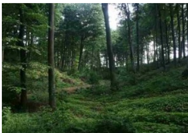
Fot. Park krajobrazowy z XIX wieku (obok dworu), łączący się z lasem, aleja kasztanowców czerwonokwiatowych, parów leśny.

BUDYNEK MIESZKALNY - dwojak nr 2, murowany z drugiej połowy i końca XIX wieku.