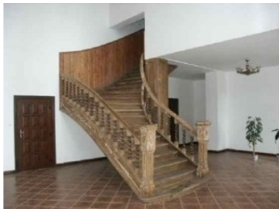
Fot. Zespół pałacowo-folwarczny z poł. XVIII, poł. i końca XIX oraz początku XX w.