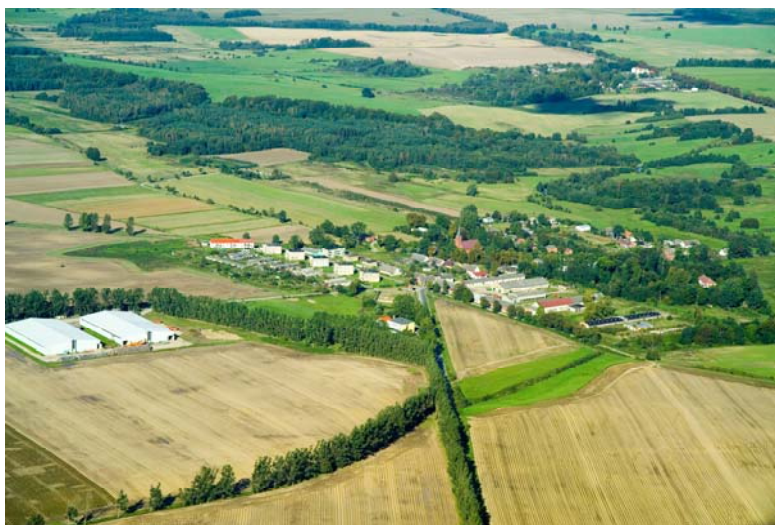
Zdjęcie lotnicze dla sołectwa Damno.

Miejscowość Damno zajmuje powierzchnię 1.147,35 ha, w tym użytki rolne 890,63 ha (77,6%), lasy 174,49 ha (15,21%), tereny zurbanizowane 50 ha (4,36%), nieużytki – 13,30 ha (1,16%), wody 17,03 ha (1,48%) oraz tereny różne – 1,90 ha (0,17%).