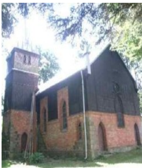
Fot. Kościół w Domaradzu

Kościół ewangelicki ob. rzym.- kat. fil. p.w. św. Stanisława Kostki w Domaradzu (murowany, ufundowany i wybudowany w 1907 r., prawdopodobnie przez Paula von Zitzewitz, właściciela Domaradza).