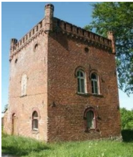
Fot. Pawilon parkowy, myśliwski w Domaradzu

Park podworski - stare jodły, żywotniki, cyprysiki, choiny kanadyjskie, jedlice, świerki, aleja dębów piramidalnych, buk zwisający.