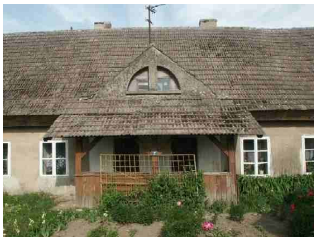
Fot. Budynek mieszkalny – dwojak z XIX w.

BUDYNEK MIESZKALNY - dwojak nr 2, murowany z drugiej połowy i końca XIX wieku.